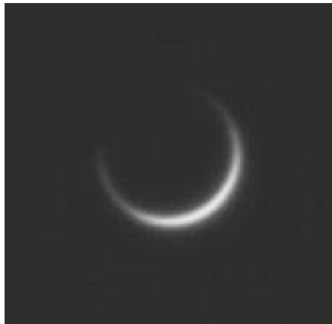
Venus ca. 3,5° vom Sonnenrand entfernt. Die Sichel überspannt schon deutlich mehr als 180°, ist aber noch nicht geschlossen.

ausfiel, musste ich mit einem schnell beschafften Ersatz arbeiten, der leider deutliches Spiel in Elevation hatte. Zusammen mit dem böigen Wind vor Ort an den Beobachtungstagen war es dann ein arger Kampf, den Venusring korrekt fokussiert in das kleine Gesichtsfeld zu kriegen. Dennoch konnte am Vortag des eigentlichen Transits nach zwei Stunden Gewürge die Venus endlich gefunden werden. Auch wenn die sehr lange Konstruktion im Wind vibrierte, konnte der Venusring bei ca. 26 Bogenminuten Abstand vom Rand der Sonne aufgenommen werden. Das Ergebnis sieht zwar nicht sehr schön aus, ist aber doch zumindest etwas sehr seltenes.