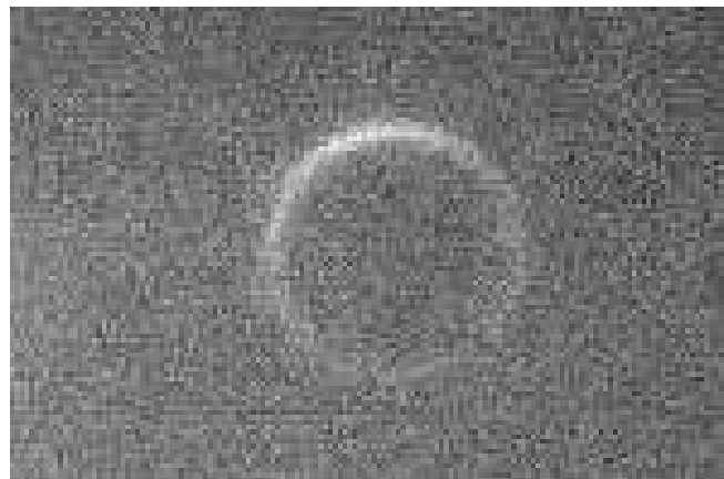
Venusring bei weniger als 0,4° Abstand vom Sonnenrand. Visuell war der Ring deutlicher zu sehen, als er in diesem Bild erscheint.

Der eigentliche Transit konnte dann am nächsten Morgen entspannt beobachtet werden, leider war die Luftunruhe an diesem frühen Morgen sehr stark, da unser Standort hinter einem Bergrücken lag, an dem sich seit Sonnenaufgang eine Thermik bildete. Die Reisegruppe war halt zu faul, für eine halbe Stunde mehr an Sichtbarkeit das Ferienhaus zu verlassen. Dafür hatten wir auch alle Annehmlichkeiten der stationären Infrastruktur mit warmem Kaffee und erfrischendem Pool.